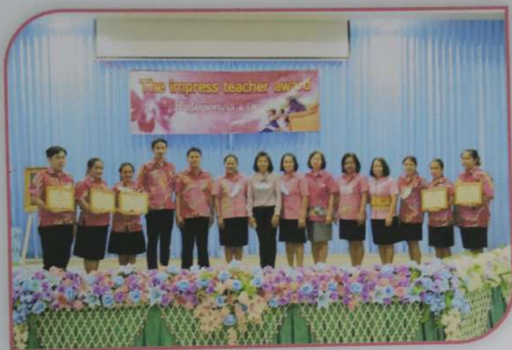
ภาพกิจกรรมโครงการ The impress teacher award ประจำปีการศึกษา ๒๕๖๓