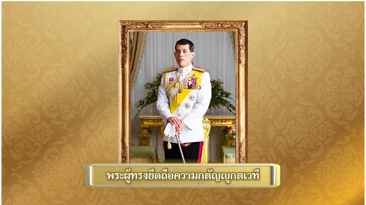
พระผู้ทรงยึดถือความกตัญญูกตเวที